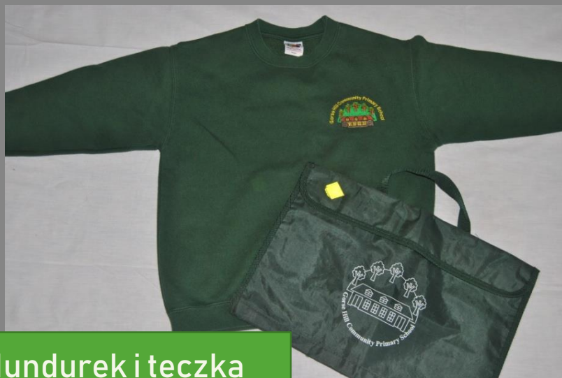
Mundurek i teczka